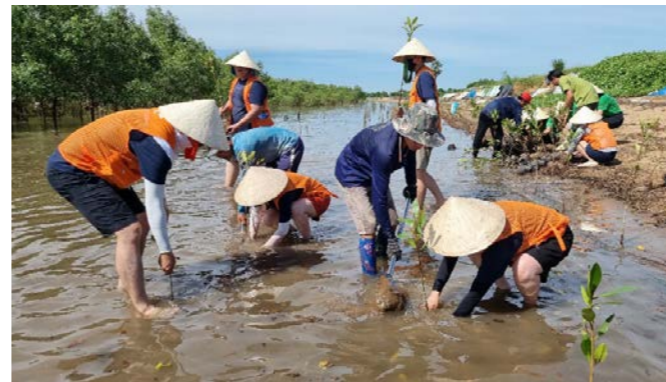
SK이노베이션, 맹그로브 숲 모듬 식수 활동

SK이노베이션은 2017년부터 국내 최대 규모의 발달장애인 음악축제인 Great Music Festival(GMF)을 매년 개최함으로써 음악을 매개로 발달 장애인이 성장할 수 있는 기회를 제공하고 있습니다. 2022년까지 이 대회를 통해 161개의 연주 단체와 1,700여 명의 연주자를 배출하였습니다. GMF Charity Night Gala는 주한 외교사절을 초청하는 GMF 수상팀의 콘서트로 2022년에는 세계엑스포 후보도시인 부산에서 38개국의 외교 사절과 배우자를 초청하여 개최하였습니다. 2023년에는 GMF와 연계하여 미국, 중국 등 해외 지역으로 발달장애인 음악 활동 지원 프로그램을 확대하기 위해 검토 중입니다.